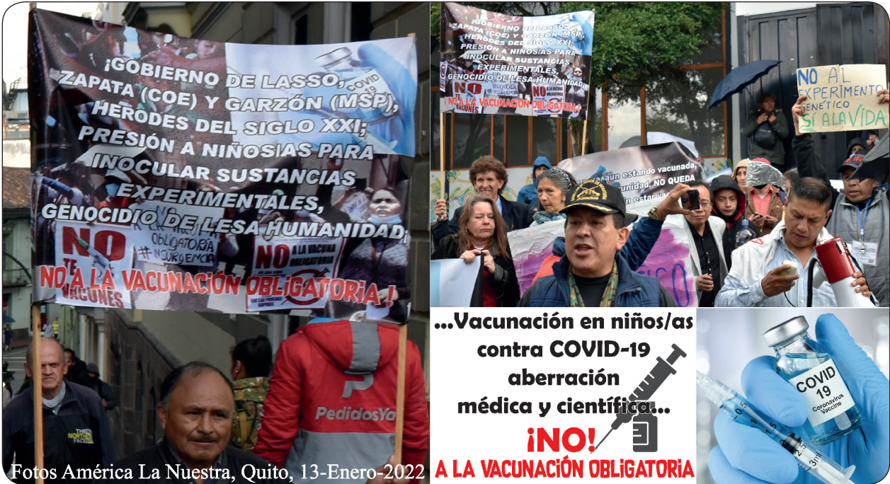
Quito, 13-Enero-2022

« Por primera vez en la historia de la vacunación, las llamadas vacunas de ARNm (ARN mensajero) de última generación interfieren directamente en el material genético del paciente y por tanto alteran el material genético individual, que es la manipulación genética, que ya estaba prohibida y anteriormente considerada como un delito en el tratado de Nuremberg de 1945 »