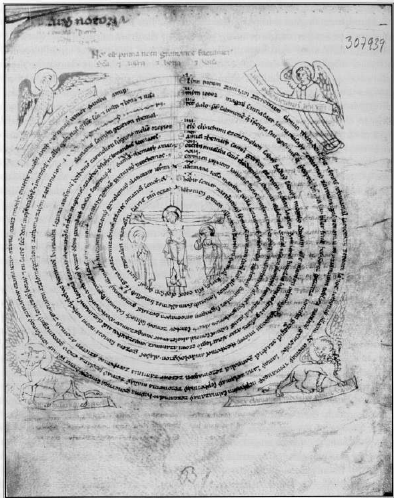
La primera nota de Gramática