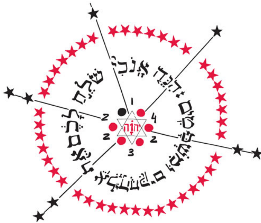
Copia del llamado pergamino «323» o de la «victoria». Sin descifrar.