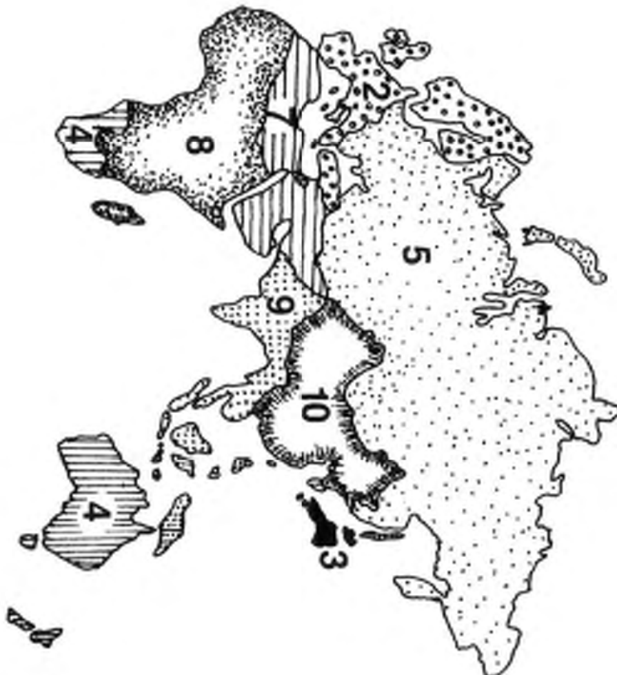
Ten Kingdoms . . . from: THE CLUB OF ROME