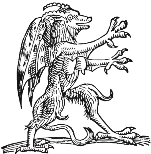
Demonio, según el libro «Milagros de Licostono». Basilea, 1537.