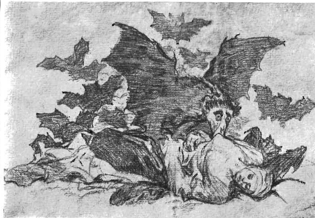
Goya: El diablo en forma de vampiro.

»En ocasiones, el Diablo hace que parezca que se aman apasionadamente, pero cuando se abrazan, se despierta en ellos un odio tremendo, muerden y arañan como seres rabiosos. Pues el Demonio enciende primero el fuego para darles el incentivo y calentarlos a voluntad, haciendo aparecer al marido la belleza de su mujer de forma que ésta resulte muy deseable. Pero apenas trata él de acercársele, cuando la presenta con un ta-