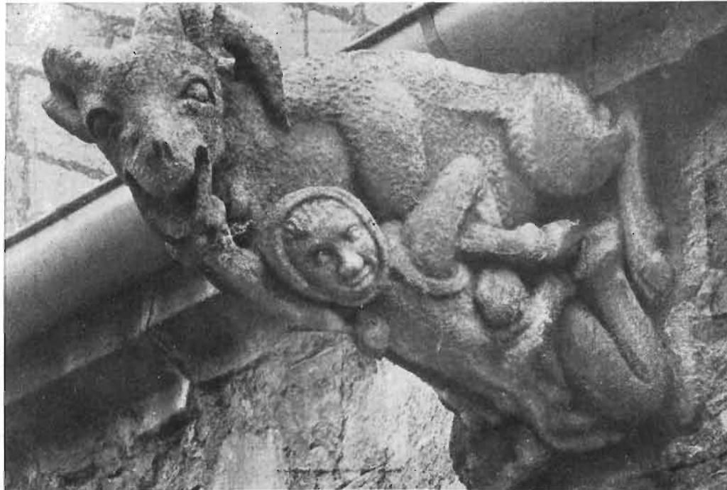
Gárgola de una iglesia francesa, que representa un demonio, en forma de macho cabrío, copulando con una mujer.

En 1484, Heinrich Kramer ( Henricus Insistoris ) fue nombrado, junto con Jakobus Sprenger, inquisidor general para las regiones de Maguncia, Colonia, Tréveris, Salzburgo y Brema, pero se enfrentó con una gran resistencia, tanto por parte del clero como de las autoridades civiles. Debido a su relación con el Papa, el 5 de diciembre de 1484, Inocencio VIII promulgó su bula Summus desiderantis , que le daría la autoridad necesaria. El texto de esta bula fue impreso como una introduc-