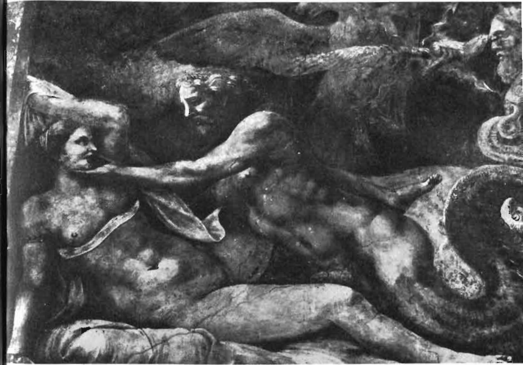
Giulio Romano (1492-1546): Zeus y Tetis.