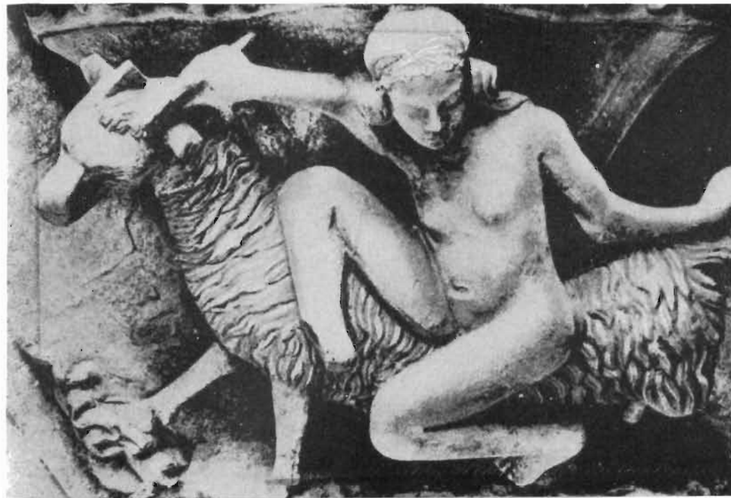
Alegoría de la lujuria y Satán, en forma de macho cabrío. Adorno de un capitel en una iglesia francesa. Siglo XIV.

»Por ello, los sacerdotes deben predicar a las gentes