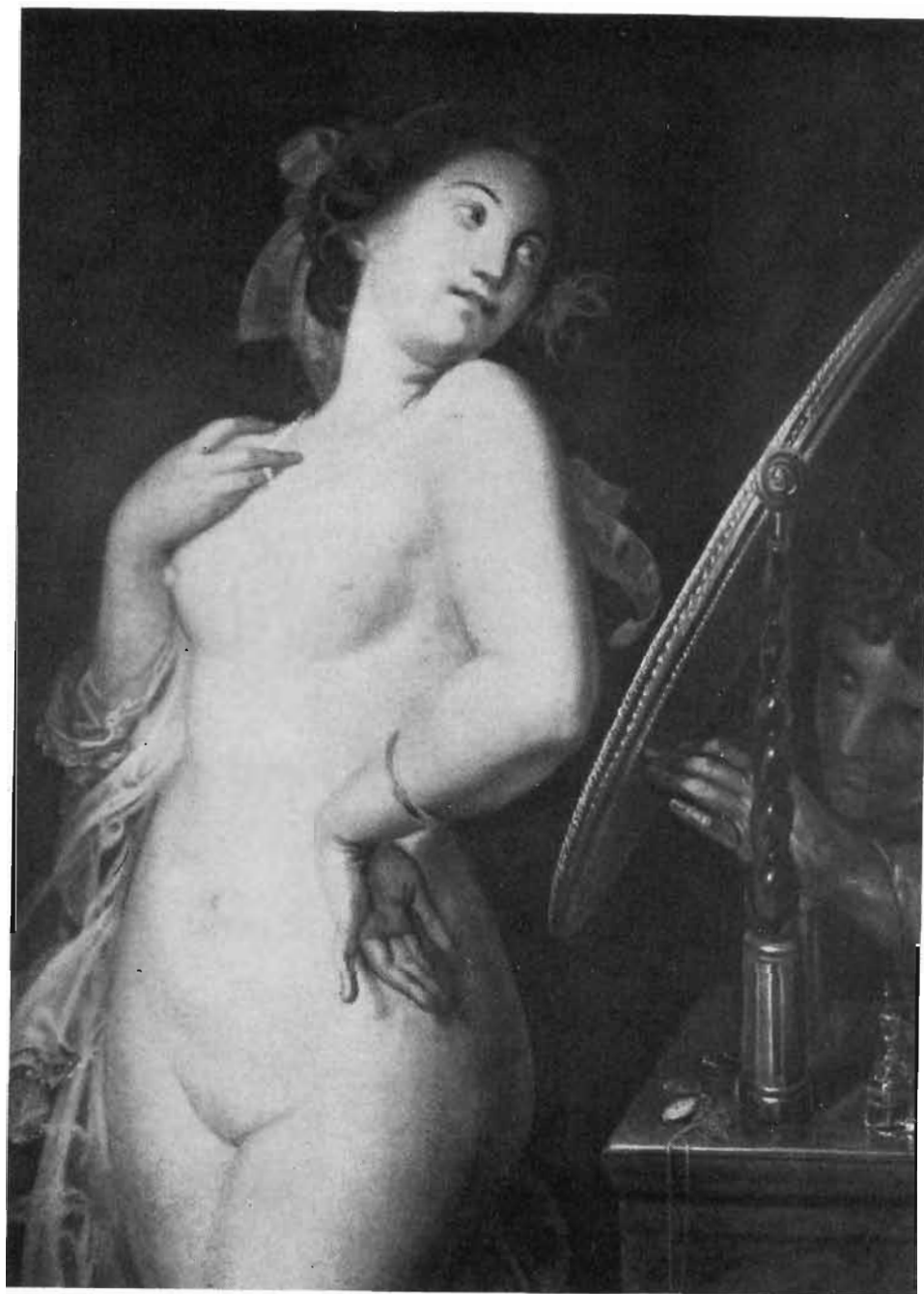
Antoine Wiertz (1806-1865): La Vanidad y Satán.

Pronto, algunos inquisidores descubrieron ciertos vínculos entre los herejes y los brujos. Solicitaron que se asimilara la brujería a la herejía, pero el Papa Alejandro IV, en 1257, se negó a ello. Mas, inevitablemente, los inquisidores encontraron casos de comercio sexual con el demonio. Y fue pronto vencida la resistencia de las autoridades eclesiásticas a la proposición de colocar tales casos bajo el mismo denominador que la herejía. En 1274, en Toulouse, por primera vez una mujer fue hallada convicta por un tribunal de la Inquisición de dicho crimen y entregada a la justicia secular, que la con-