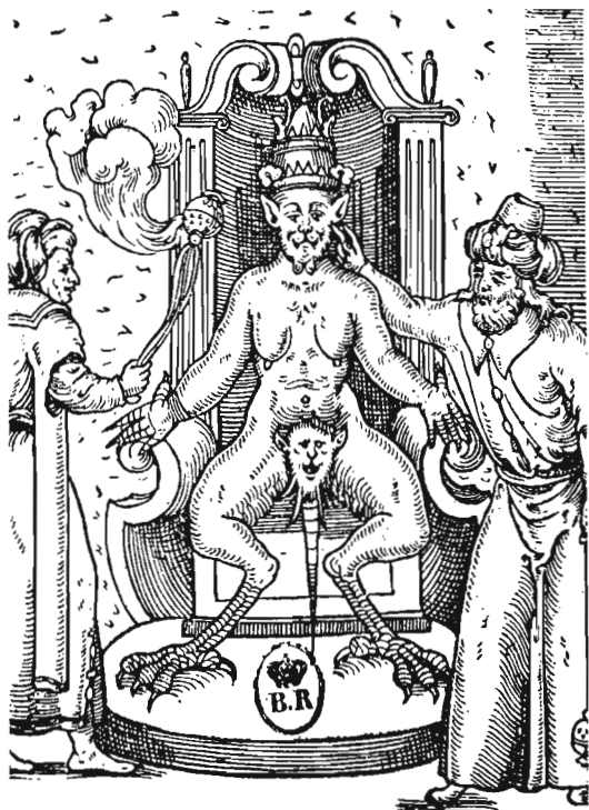
Un demonio. Grabado en madera, del siglo XV.