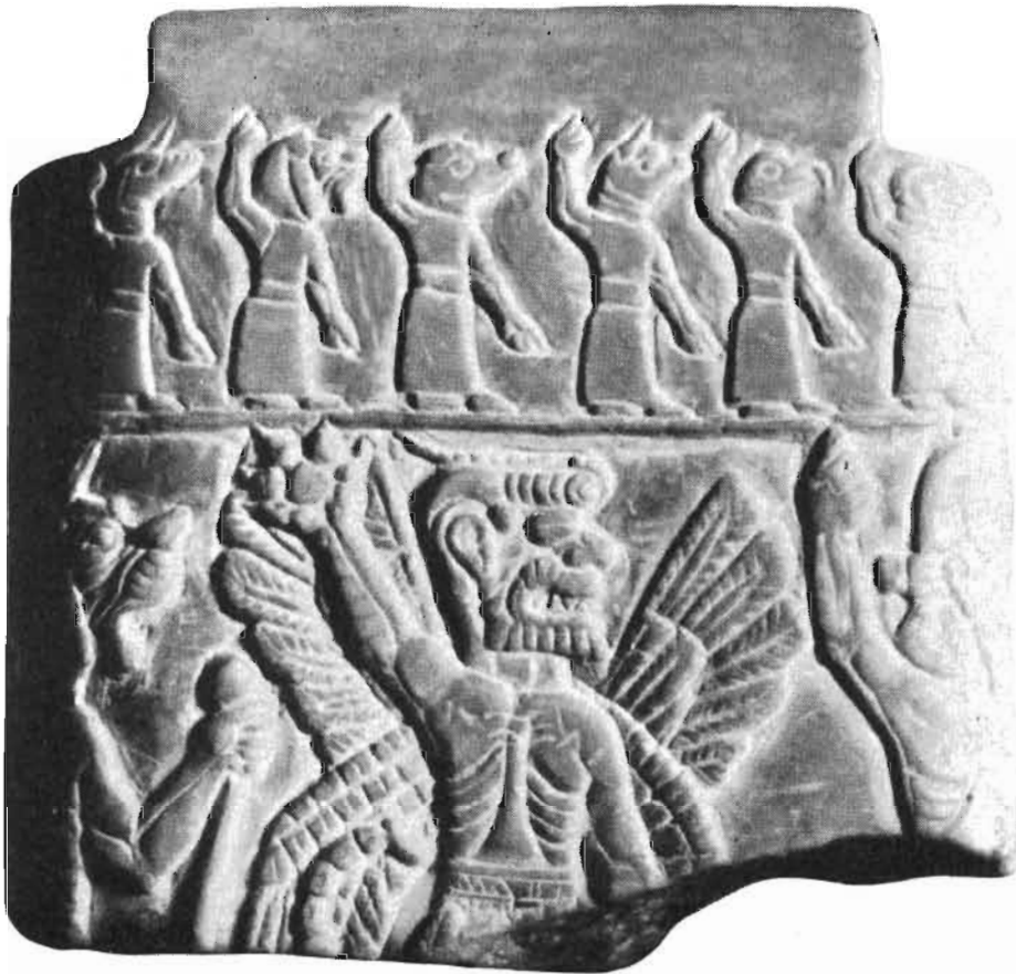
El demonio Pazuzi. Relieve babilonio. (Hacia 1800 a. de J.C.)

«Aquel ser lascivo alumbró en ella el fuego de la pasión, se echó sobre ella y la trató como a una esposa, tras haber pasado una de sus manos sobre su cuerpo y la otra por encima de su cabeza. Adúltero invisible, venía por la noche, mientras la mujer estaba acostada cerca de su marido, que permanecía ignorante de todo, y se libraba a la lujuria sobre ella. Durante seis años, ese mal permaneció oculto, y la desgraciada no descubrió su vergüenza a nadie. No obstante, al séptimo año, el espectáculo de sus crímenes acumulados y el pensamiento del juicio de Dios la aterraron. Fue en busca de los sacerdotes y confesó su oprobio. Luego hizo peregrinaciones e imploró a los santos. Pero ni confesiones, ni peregrinaciones, ni oraciones lograron resultado alguno: el demonio volvía cada noche y se mostraba cada vez más libertino. El crimen terminó por ser conocido, y el marido se enfureció. Y la desgraciada mujer enfermó de vergüenza. Pero ocurrió que en aquel momento San Bernardo, de paso por la ciudad, oyó hablar del caso. Visitó a la desventurada y le entregó su bastón de