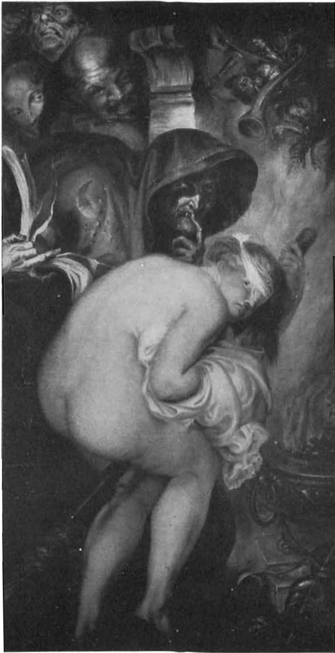
Antoine Wiertz: Salida para el aquelarre.