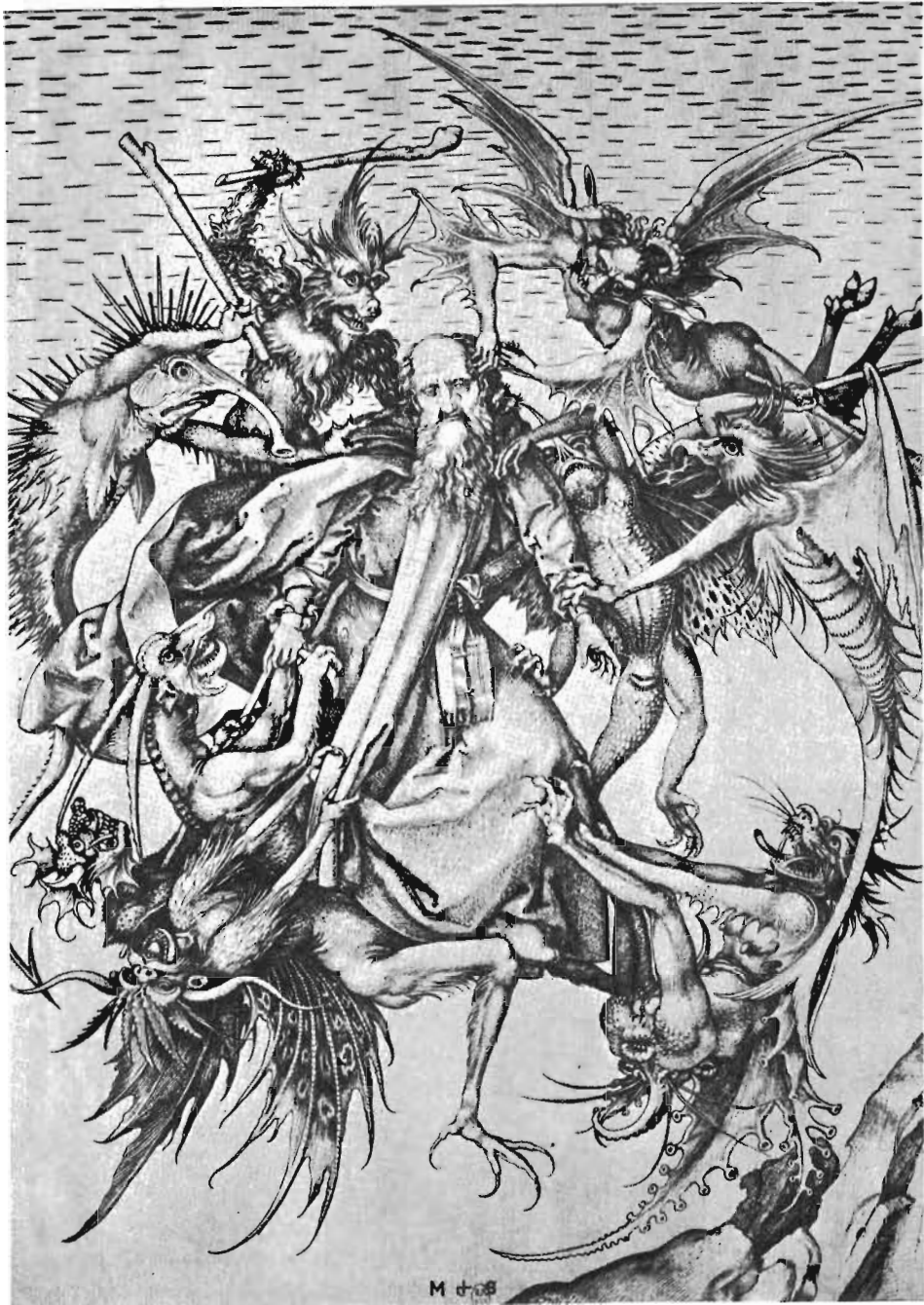
Martin Schoengauer (1440-1491): San Antonio es atormentado por demonios.