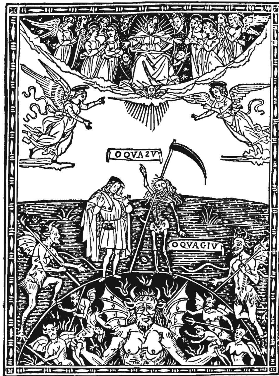
EL CIELO, LA MUERTE Y EL INFIERNO. Alegoría. Grabado en madera, del siglo XV.