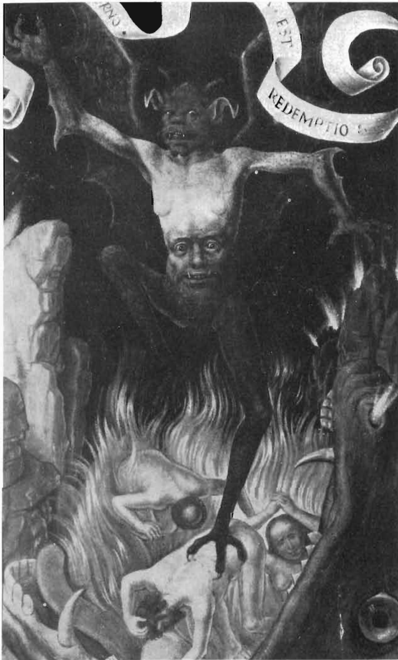
D. de Ryckel. Escuela holandesa, siglo XVI. Satán, soberano del infierno.

Demonios en forma de animales. Panel incrustado en el arpa de un rey de Ur. (Hacia 2800 a. de J.C.)