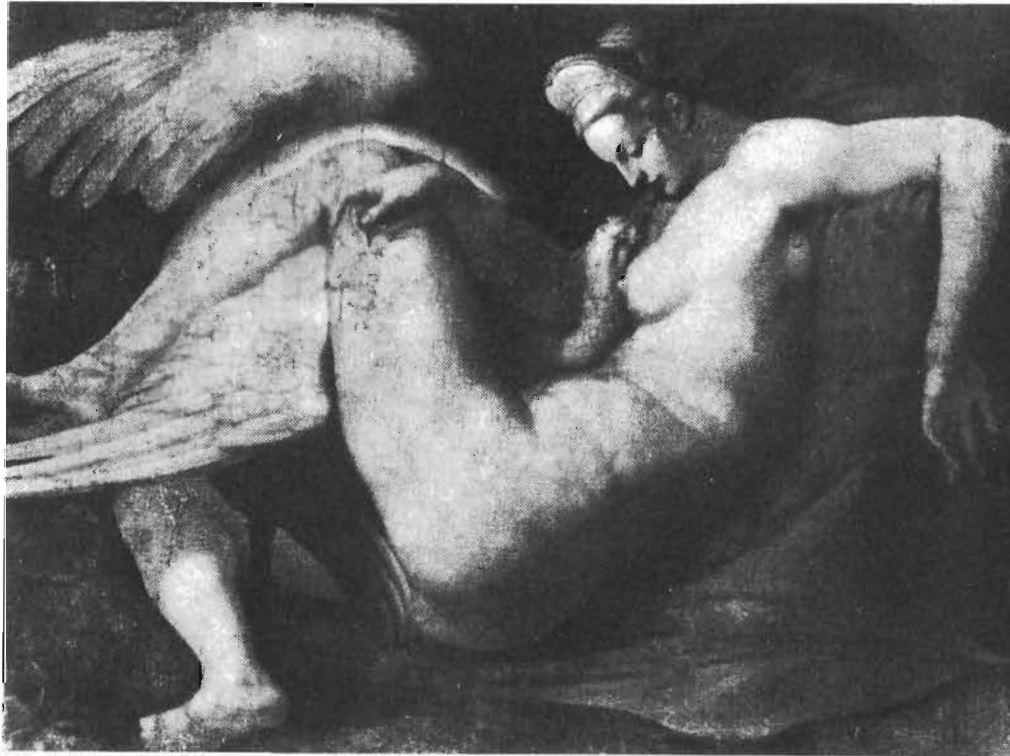
Miguel Ángel (1475-1564): Leda y el cisne. Londres, National Gallery.

»Octava razón: Cuando el Demonio maligno inserta el miembro del hombre con la naturaleza de la mujer de tal modo que ambos se encuentran atados, presos y pegados, como si fuera con liga, y tan poderosamente que apenas se les podría desligar o separar, sine maxima capitis diminutione... »