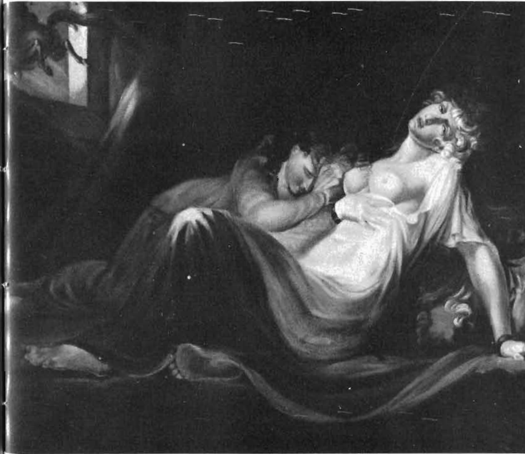
Fussli: El súcubo en el sueño. Museo de Basilea.