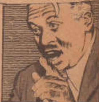
(* De la novela "Santos".

LAS HEMOS VISTO TODAS LAS NOCHES Y CON FRECUENCIA SE LES VIO ATERRI- ZAR EN ZONAS GENE- RALMENTE INACCE- SIBLES POR LA CAATINGA (*).