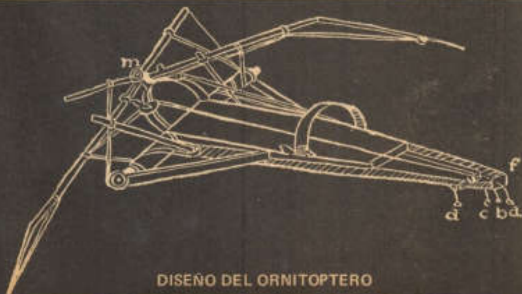
DISEÑO DEL ORNITOPTERO

En sus estudios sobre el vuelo experimentó con globos de papel encerado y diseñó varios modelos de máquinas más pesadas que el aire. Leonardo inventó también el paracaídas y el magnífico "ornitóptero", un planeador dotado con un sistema de poleas que movía las alas.