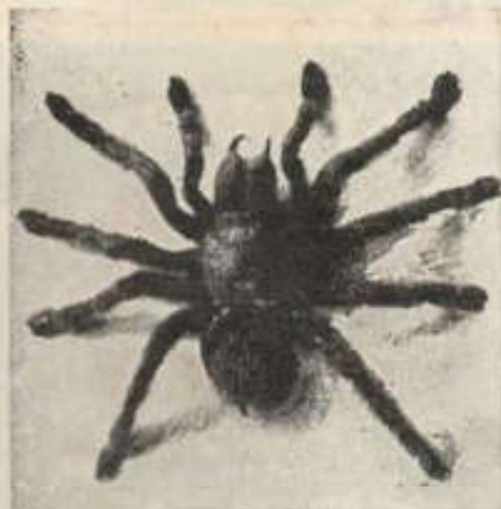
¿Fobia a los arácnidos?