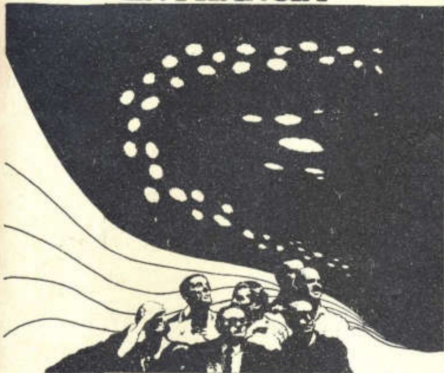
La apertura de conciencia hacia los Ovnis se está dando