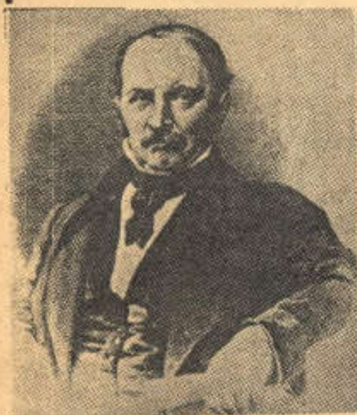
ALLAN KARDEC, fundador del espiritismo, influyó enormemente al pueblo brasileño

E l espiritualismo, que tiene sus raíces en las teorías de Anton Mesmer sobre el magnetismo animal, fue propagado por el escritor francés Allan Kardec (1804-1869). Kardec cuyo verdadero nombre era Hypolite Leon Denizard Rivail, escribió un libro en 1856 llamado El libro de los Espíritus que pronto le ganó fama y adeptos por toda Europa. Los seguidores de Kardec adoptaron el nombre de "espiritismo", para distinguirlo del espiritualismo ; la diferencia entre espiritismo y espiritualismo es que el primero pone su principal énfasis en la reencarnación, mientras que el segundo la rechaza.