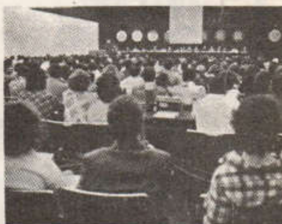
Un aspecto del salón Chapultepec, en el hotel Camino Real, durante el simposio.