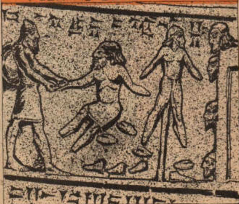
LIBROS DE EDITORIAL POSADA, S.A.

EXISTEN MÚLTIPLES RELIEVES EN LOS QUE SE DESCRIBEN MINUCIOSAMENTE LAS TORTURAS A LOS PUEBLOS VENCIDOS, DONDE ERAN CORTADOS MANOS Y PIES, DE LAS VÍCTIMAS, Y DESPUÉS EMPALADAS AÚN VIVAS A LAS PUERTAS DE LA CIUDAD.