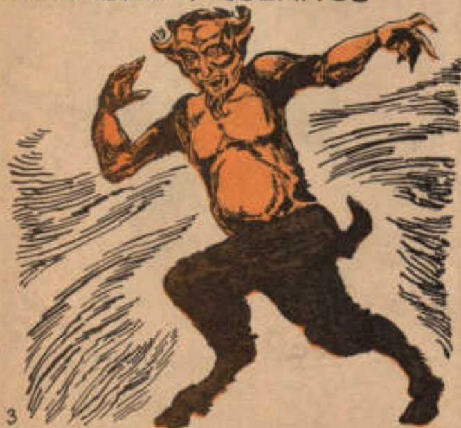
FIGURA QUE PASÓ EN LA EDAD MEDIA A PERSONIFICAR A SATANÁS Y SER LA PARODIA DE CRISTO.

QUE CON EL TIEMPO SE CONVIRTIO EN EL DIOS PAN O PRIAPO, DIOS MITAD HOMBRE Y MITAD BESTIA CON PATAS DE CABRA Y CUERNOS