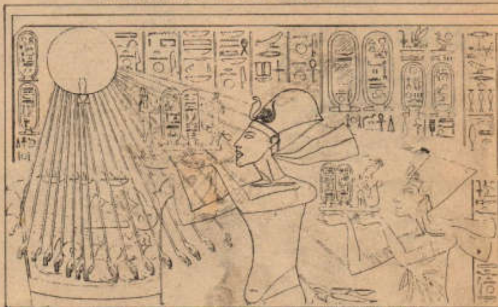
Aton en forma de disco refulgente transmite su energía a Akhenaton y Nefertiti.

tenía solamente 15 años, y Egipto se hallaba en un estado avanzado de corrupción y decadencia; todas las clases sociales se interesaban únicamente en adornarse con grandes joyas, los sacerdotes ya no eran sabios sino que se habían convertido en la policía secreta del reino y en una secta cuyo poder pasaba de padres a hijos. Los sacrificios ofrecidos a los dioses les proveían de comida y bebida, los templos eran sus espaciosas residencias y recaudaban grandes cantidades de impuestos que los hacían cada vez más ricos.