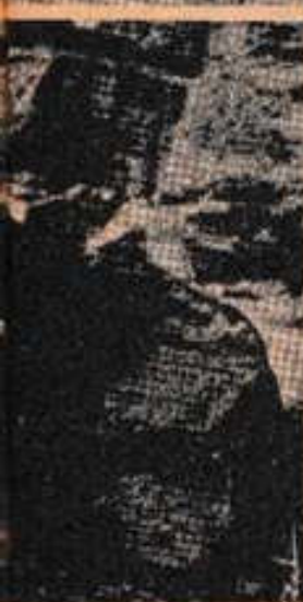
Bloque de piedra con características rúnicas. Todos los científicos han coincidido en que las inscripciones pertenecen a la antigua escritura nórdica.

precolombino, principalmente con las momias blancas de Paracas, entre las que abunda el tipo ario-nórdico; estas momias son un irrefutable testimonio de la existencia de aquellos grupos vikingos que fueron reproducidos en la iconografía alta y baja del Perú. Esta especie de "confabulación" surgió cuando los que se resistían a reconocer la gran empresa puesta en marcha por el profesor Mahieu, se decidieron a aportar datos y pruebas arqueológicas que enriquecieron aún más la sacrificada tarea científica. Asimismo, la prensa local rompió el silencio y dedicó en sus páginas grandes artículos haciendo referencia al hallazgo de inscripciones rúnicas y acerca del origen étnico de los guayakíes.