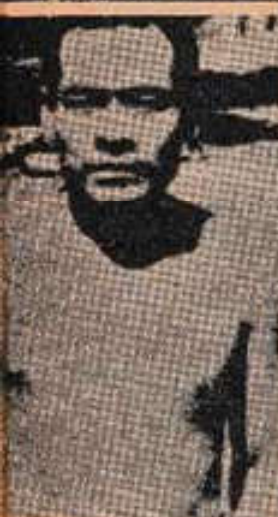
Un guayakí moreno y otro de piel lechona, descendientes de vikingos que llegaron a Paraguay procedentes del Perú.