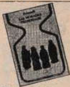
LAS MORADAS FILOSOFALES , Fulcanelli (Plaza & Janés-Colección: Otros Mundos)

Se trata, pues, de un libro valiente, ameno y profusamente documentado que debe ser conocido por el mayor número de personas interesadas en el fenómeno OVNI.