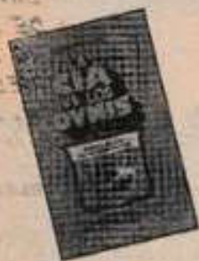
LA CIA VS LOS OVNIS Rudolph G. Aicardi, Editorial Posada

Al fin aparece un libro que cuenta la historia completa de cómo la mayor red de espionaje del mundo se ha encargado de conspirar contra los OVNIS. El autor es un periodista de larga experiencia que como rata de archivo pasó varios meses en bibliotecas y hemerotecas de Estados Unidos recopilando datos sobre las siniestras actividades de la CIA. Teniendo como punto de partida las investigaciones de importantes estudiosos de los OVNIS, como el famoso mayor Donald Keyhoe, Aicardi intenta desenmascarar las ilícitas maniobras de que se ha valido la Agencia para ocultar y tergiversar información sobre uno de los fenómenos más importantes de nuestra época.