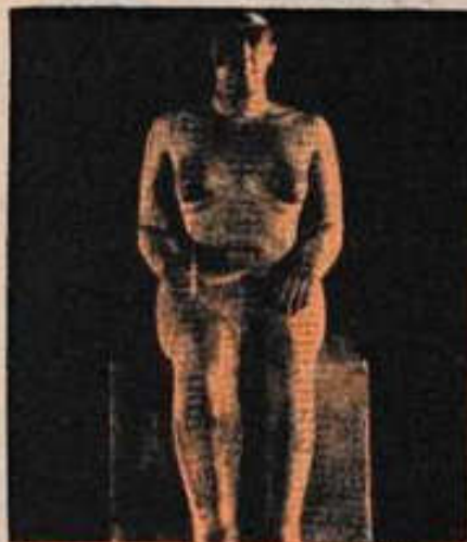
Esta escultura muestra cómo la mano izquierda es el receptor de la energía cósmica y la derecha es el emisor.

timo hizo célebre en Grecia y en nuestro mundo moderno, con el nombre de eurytmia y paneurytmia, o el arte del movimiento armonioso.