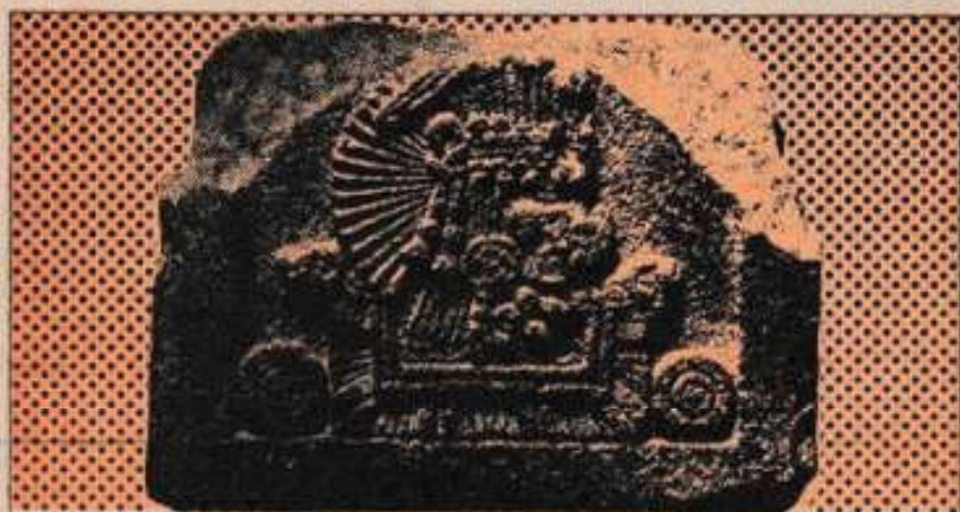
El símbolo de Atonatuh, "El Sol de Agua", tercera edad cósmica que acaba con el diluvio, aparece en el centro del Calendario Azteca.

La segunda edad, o Sol de Viento , nahui eecatl , fue diezmada por una tempestad mágica, en el curso de la cual Quetzalcóatl, la Serpiente Emplumada, dios del viento y rival mítico de Tezcatlipoca, meta-