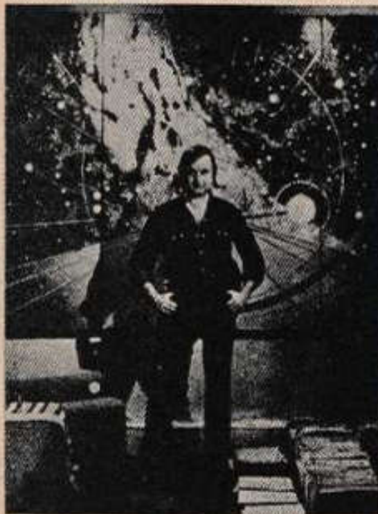
El famoso psíquico Ingo Swann comprobó que la profundidad marina no es obstáculo para la telepatía.

"Esto significa un gran avance, ya que ese mismo estudio se realizó hace 25 años y solamente un 3 por ciento creía que sí existía la percepción extrasensorial —dijo el doctor Wagner—, un 14 por ciento creía que tenía muchas posibilidades; 34 por ciento creía que se trataba de algo desconocido; 39 por ciento una posibilidad remota, y 10 por ciento un imposible".