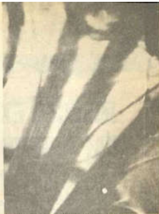
Amplificación de 240 veces del tamaño normal de un tentáculo del probable insecto extraterrestre. Es sorprendente su similitud con una araña terrestre.

"El asunto del organismo biológico no termina aquí; al contrario, este es el comienzo, porque nos hemos echado encima un desafío