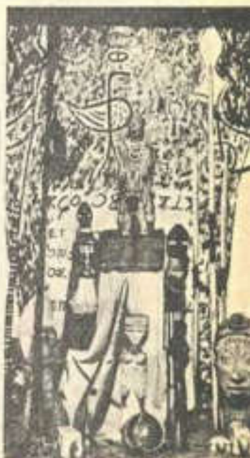
Este es el santuario donde se han llevado a cabo sangrientos ritos, que culminaron con el asesinato de una niña.

Los vecinos afirman que Borel desde hace tiempo está "loco" con la idea del tesoro y que es él el único responsable de la muerte de la pequeña, ya que los brujos le dijeron que encontrarían el tesoro si les proporcionaba una víctima propiciatoria.