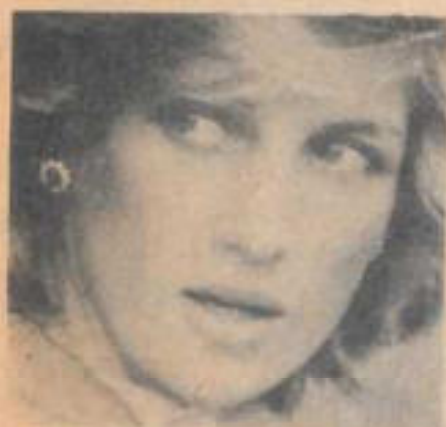
Nada se puede hacer por salvarla.

La Princesa Diana y toda la familia real pueden haber caído bajo un fatal hechizo al haber aceptado inocentemente un amuleto Tiki robado; esto ocurrió durante una visita de Diana a Nueva Zelanda.