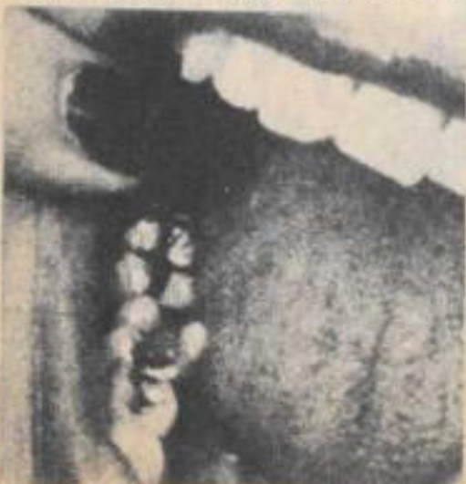
Las obturaciones tienen forma de cruz.

"Es sólo el poder de Dios —asegura el reverendo Davis—; en los seis años que llevo orando para realizar estos milagros, he ayudado a cientos de personas".