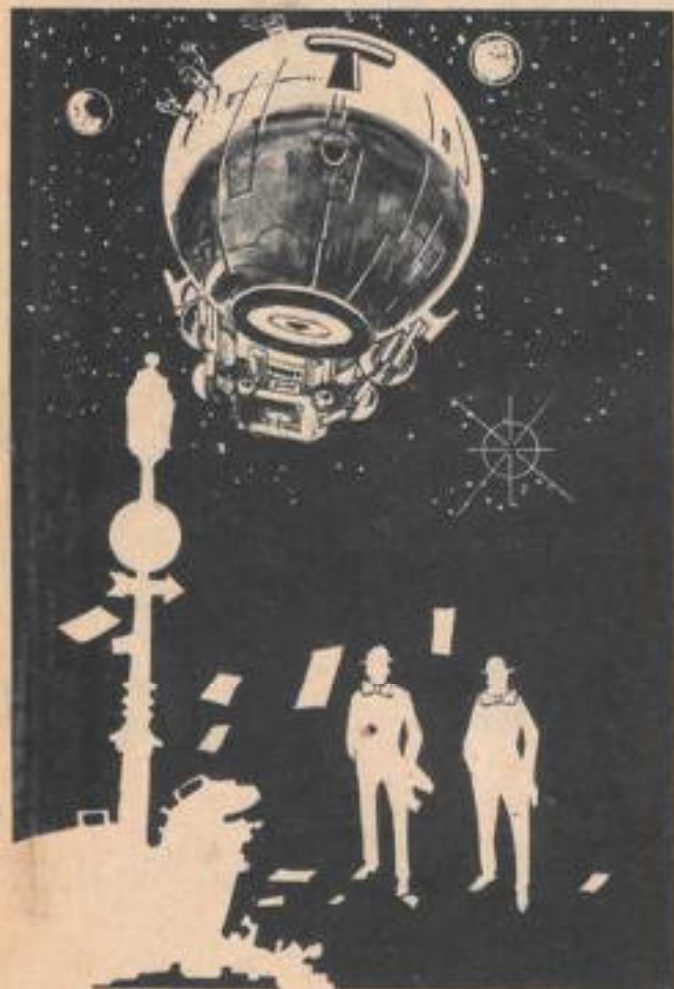
Tras de descender del Mustang, los misteriosos personajes vestidos de negro y con corbatas rojas idénticas, abordaron tranquilamente el OVNI.