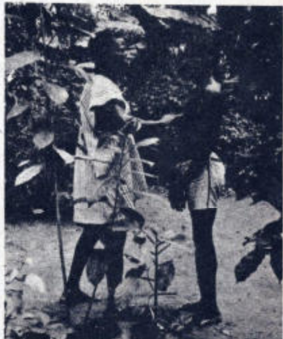
Varios habitantes de Zaire afirman haber sido curados por el ex arzobispo de Lusaka.

Después de la ceremonia, monseñor Milingo regresó al Vaticano, donde, según dijo, trata unos 150 casos diarios, algunos incluso por la vía telefónica.