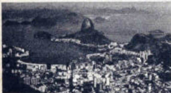
Vista panorámica de la ciudad de Río de Janeiro, donde aconteció este hecho singular.

En realidad, cuatro delincuentes lo estaban esperando para apoderarse de la llave de su caja de caudales. La llegada de los policías desató una terrible balacera, en la cual murieron dos de los ladrones, uno más quedó herido y otro, logró escapar.