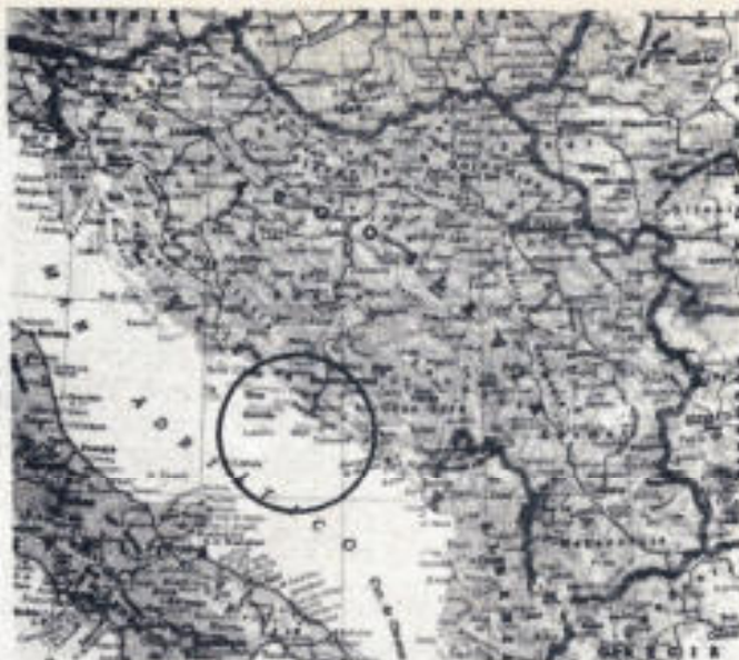
Según un investigador yugoslavo, fue en las costas del Adriático donde una vez se encontró situado el continente de la Atlántida.

Según él, todos los detalles concuerdan; trazando los círculos de que habla Platón, podría localizarse con precisión el emplazamiento de la capital de la Atlántida, y está seguro de que entre el fondo de la Bahía de Tivat, a no más de nueve metros de profundidad, deben encontrarse vestigios del Templo de Poseidón. Afirma, además, que las ruinas, aún visibles en una isla frente a Tivat, provienen del centro de un barrio comercial de la Atlántida.