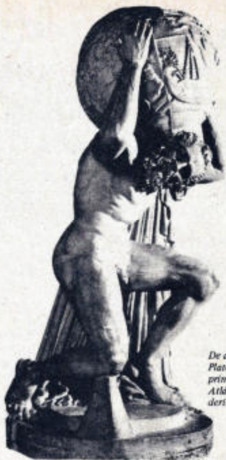
De acuerdo con Platón, Atlas fue el primer rey de la Atlántida, y de ahí deriva su nombre.