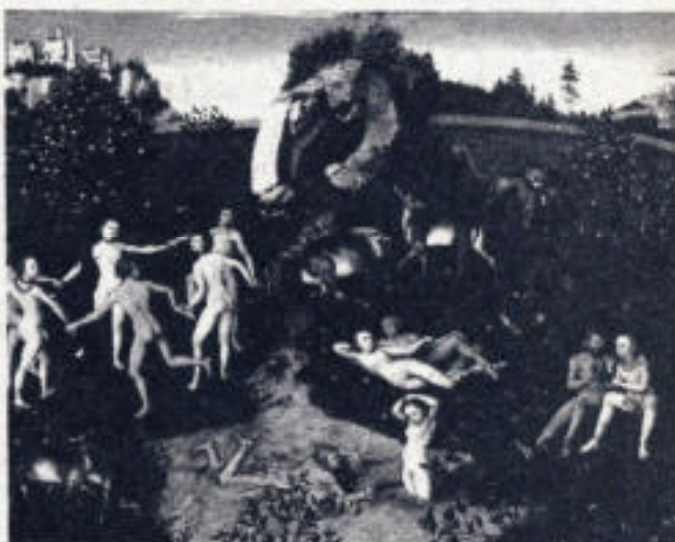
Pintura alegórica que representa la Fuente de la Juventud. Ahora, un explorador afirma haber descubierto un milagroso manantial que podría ser este sitio de maravilla.

"Es sabido por todo el mundo, que los más famosos balnearios curativos del mundo contienen dicho tipo de radioactividad", comenta Zink; quien dijo además que el manantial se compone de agua dulce, que se mezcla con agua del mar cuando la marea sube, pero que cuando está baja es dulce.