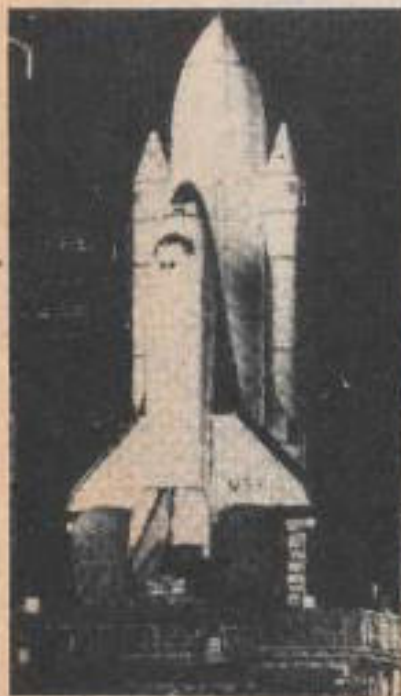
El transbordador norteamericano "Challenger", ha sido escenario de múltiples incidentes misteriosos cuyo origen no ha podido explicar la NASA.