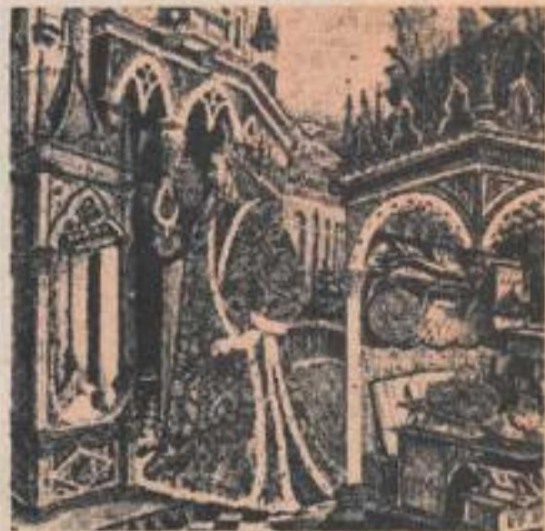
Claudio Ptolomeo, matemático y astrónomo que, según se dice, elaboró un mapa de América en el siglo I de nuestra era.