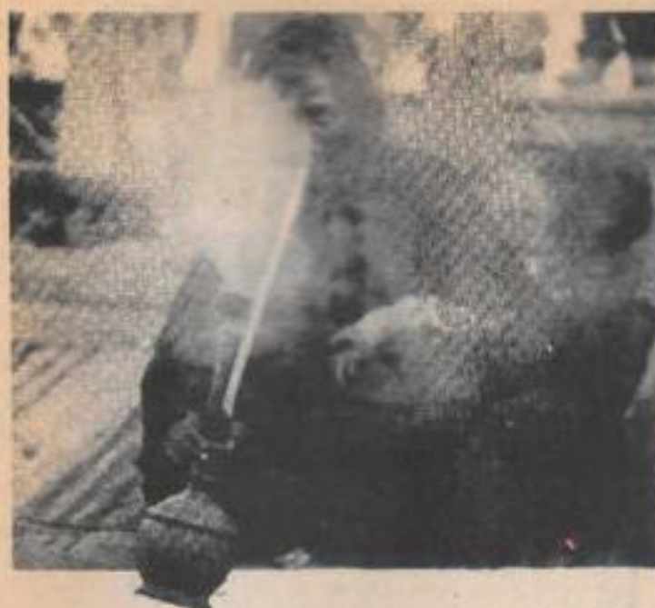
Existen alucinaciones producidas por ciertos tipos de drogas, como el hachís, cuyo uso es común en ciertos países de Oriente.

ción. Suscitán ideas de envenenamiento, de rechazo de los alimentos.