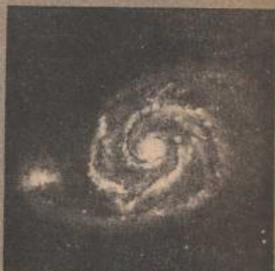
Este descubrimiento plantea la posibilidad de que existan otras formas de vida fuera de nuestro Sistema Solar.

Los científicos afirman que antes de llegar a ninguna conclusión, deben identificar el nue-