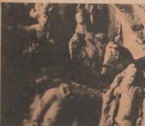
Las figuras halladas en la Gran Tumba Imperial, en 1974, pertenecen a la Dinastía Qin. Los descubrimientos recientemente son de la Dinastía Han.

Las figuras estaban enterradas a tres metros de profundidad, al pie de la colina Shizi (leones), en dos pozos rectangulares.