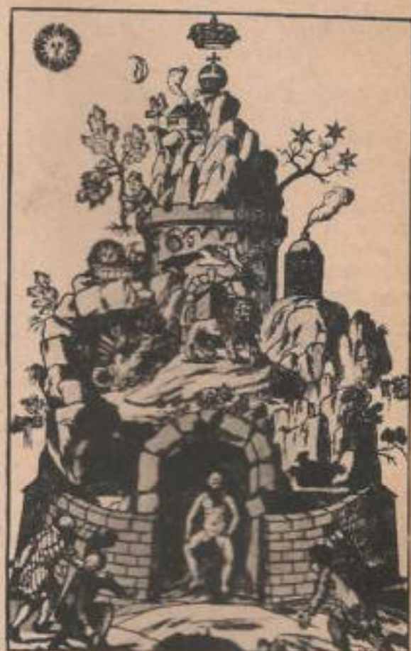
La tumba del alquimista Christian Rosenkreuz.

Con la llegada del siglo XVIII, la alquimia parece apagarse o reducirse a la química propiamente dicha. Con las teorías de Lavoisier, según las cuales la noción