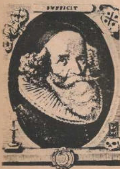
Johann Valentin Andreae, uno de los adeptos más importantes del movimiento Rosacruz.