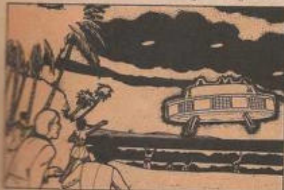
Muchos cubanos han sido testigos de la aparición de OVNIS en su país.

El padre Concetti censuró anteriormente a la astrología, y sostuvo que los horóscopos son a menudo contradictorios con el Evangelio, y que la astrología "se interna en el terreno de la superstición".