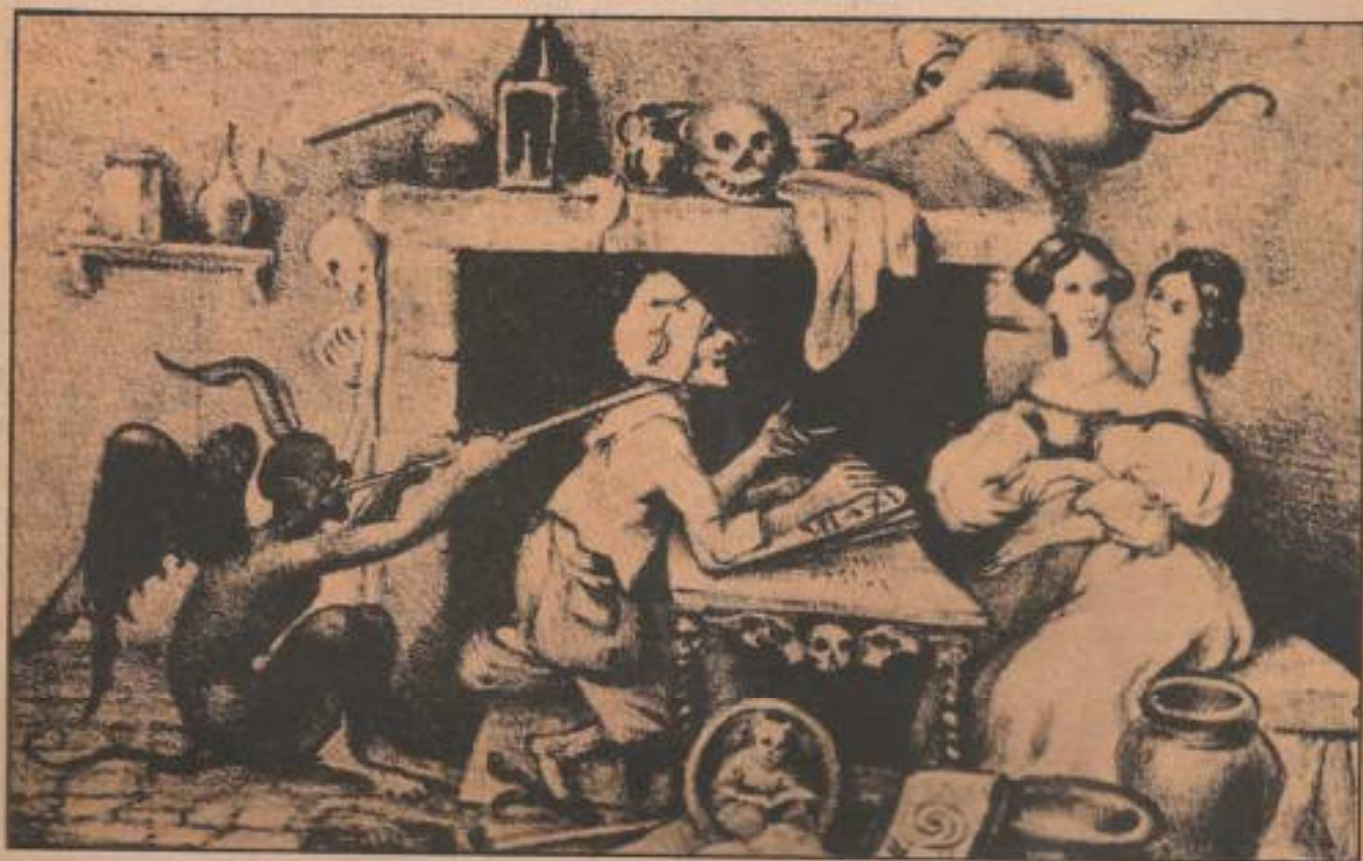
Las brujas eran consideradas como esclavas de Satanás.

INICIAMOS UNA SERIE SOBRE LOS ORIGENES Y DESARROLLO DEL SATANISMO, DOCTRINA APARENTEMENTE ABERRANTE QUE SE HA CONSERVADO HASTA NUESTROS DIAS. EN ESTE LARGO RECORRIDO A TRAVES DE LA HISTORIA SE TRATA DE IDENTIFICAR CON PLENO CONOCIMIENTO A UNA TRADICION ESOTERICA CUYA INFLUENCIA HA SIDO PRIMORDIAL EN OCCIDENTE