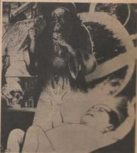
Desde el Vaticano se han emitido graves advertencias contra quienes practican la magia.