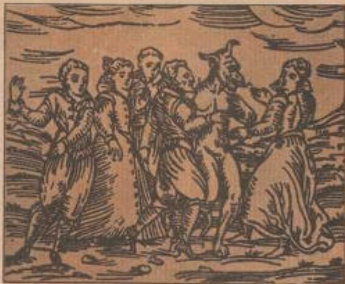
Brujas bailando en el Sabbat.

El maniqueísmo, religión fundada por Mani o Manes, iraníano que vivió en el siglo III en Oriente, pretendía unificar las enseñanzas de Buda, Zoroastro, Moisés y Jesucristo. Explicaba las contradicciones de la vida