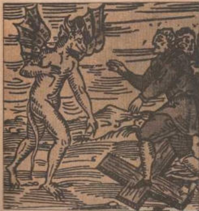
El mismo demonio instrúa a sus adeptos a pisotear la cruz. Grabado del siglo XVII.

Pero tampoco podemos asimilar la brujería a la magia negra o magia maléfica. Aunque aquella es heredera directa de ésta, hay cierta diferencia de actitud que es importante destacar. El mago, sea que practique la magia blanca o la negra, "domina" las fuerzas que utiliza. En cambio el brujo se "somete" a los entes del más allá que le dan sus poderes. El mago ordena, el brujo es un esclavo de Satanás. El mago tiene "poderes", el brujo no, todo lo que hace lo realiza en realidad el Demonio por su intermedio.