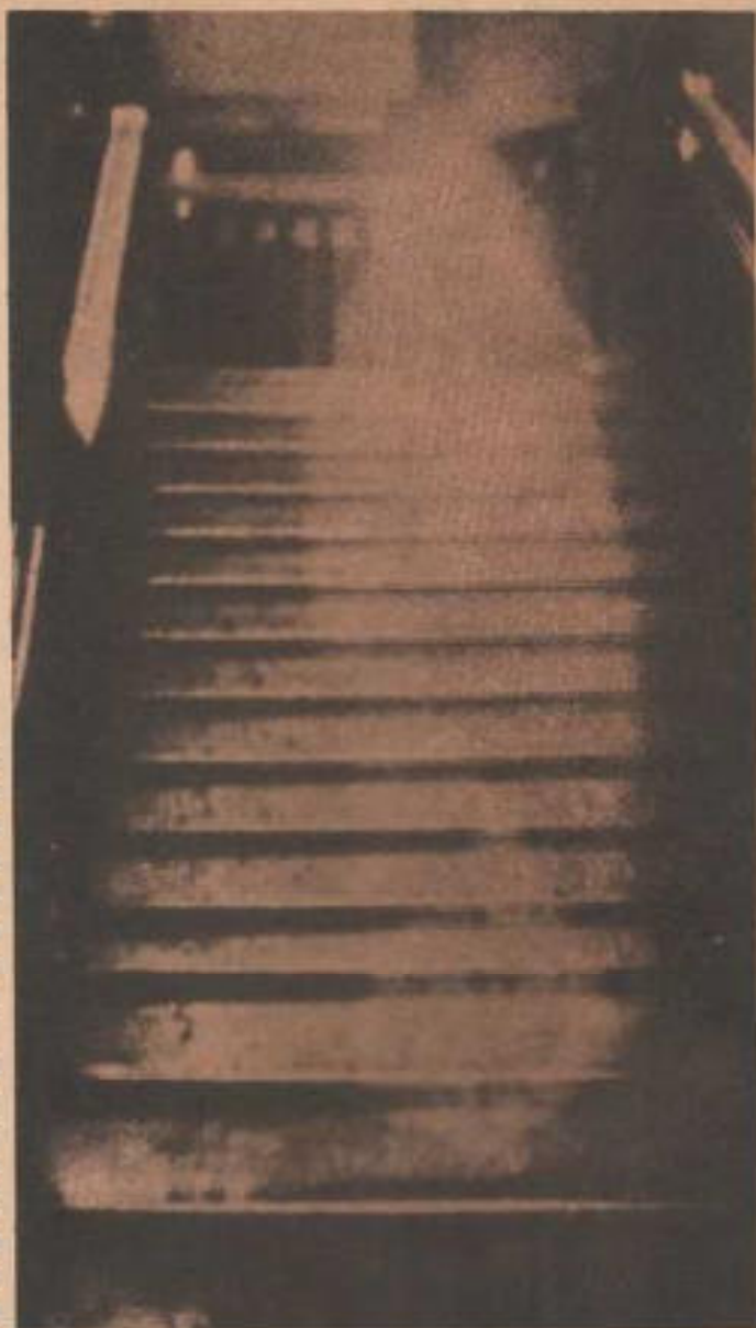
Existe toda una corriente en parapsicología que explica los "fantasmas" de antaño como fenómenos estrictamente psicoquinéticos.

La PK explicaría dos tipos de fenómenos: los comúnmente atribuidos a los fantasmas, que serían verdaderas condensaciones de energía psíquica acumu-