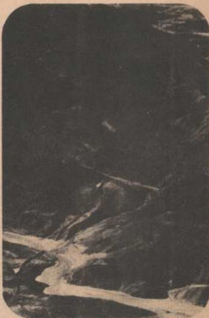
En los enigmáticos andes peruanos se encuentra la ciudad perdida de Vilcabamba, último reducto del imperio incaico.

Savoy y Santander también fueron atraídos por la leyenda. Conducidos por guías indígenas se internaron en la agreste región situada al noroeste de Macchu-Pic-