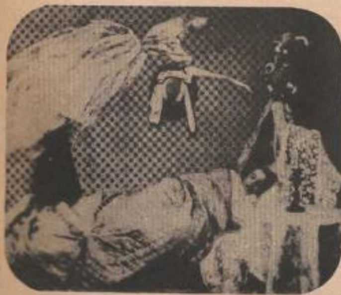
Los objetos cobran vida: el fenómeno de la psicoquinesis ha sido ampliamente comprobado, pero hasta ahora no ha recibido una explicación convincente.

Esta acumulación de pruebas sobre los poderes aún ignorados de la mente nos induce a alegrarnos de que hombres de ciencia responsables, como el doctor Rhine y sus discípulos hayan emprendido la tarea de estudiarlos, pues no dudamos que una vez que el hombre haya conseguido dominar estas facultades, una nueva fuente de energía con posibilidades ilimitadas estará al servicio de la sociedad.