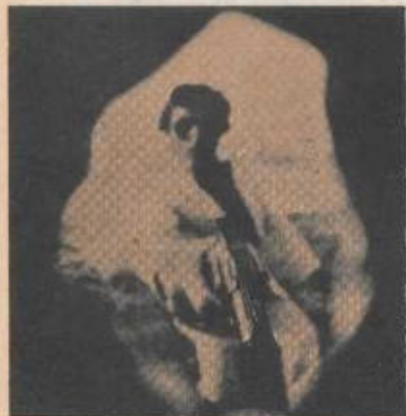
Un pacto con el diablo convirtió en delincuente a un joven ejemplar.