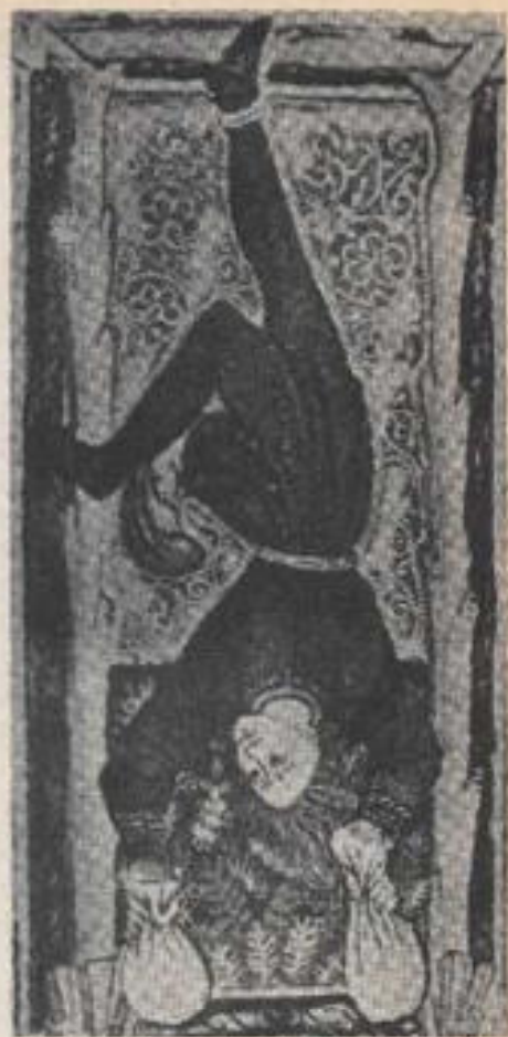
El Ahorcado, carta del Tarot que significa providencia.

Todas las cartas de la Arcana Mayor poseen un simbolismo muy profundo—cada una de ellas es una representación pictórica del saber esotérico antiguo—; algunos de estos diseños despliegan la imaginación y despiertan el subcons-