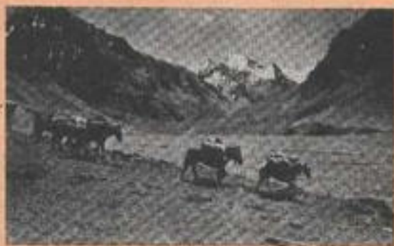
Vista del Aconcagua desde la ciudad de Mendoza, Argentina.