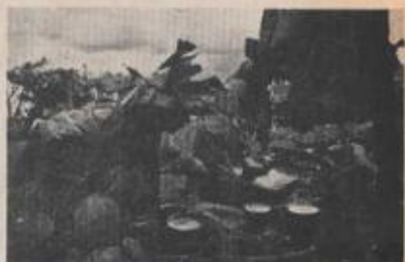
Curanderos y brujos son respetados en toda la República Mexicana.

Zetina recordó que aún proliferan los brujos en la región que fuera cuna de la importante civilización prehispánica y reconoció que, "en la cura de toda