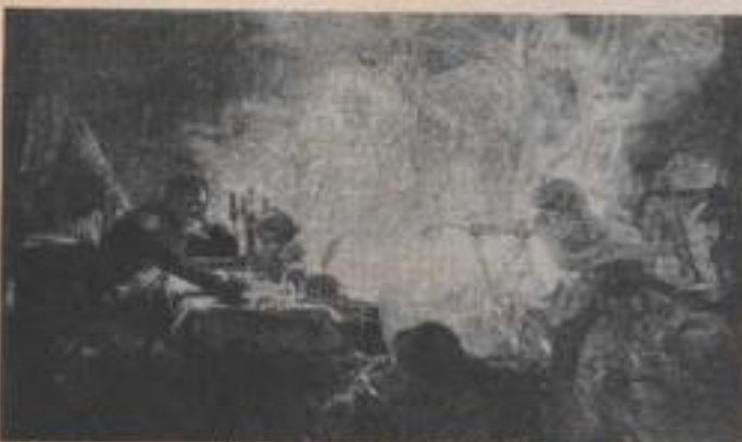
Los sueños premonitores, como el de Napoleón han sido frecuentes en la historia de la humanidad.

Los sueños nos ponen frente con todo tipo de cualidades y dotes ocultas que desconocíamos poseer. Al formar puente entre el cuerpo y la mente, pueden emplearse como trampolín desde el que saltar a nuevos campos de experiencia situados más allá de nuestra conciencia de vigilia; ampliando así nuestra visión no sólo de nosotros mismos sino también del Universo en que vivimos.