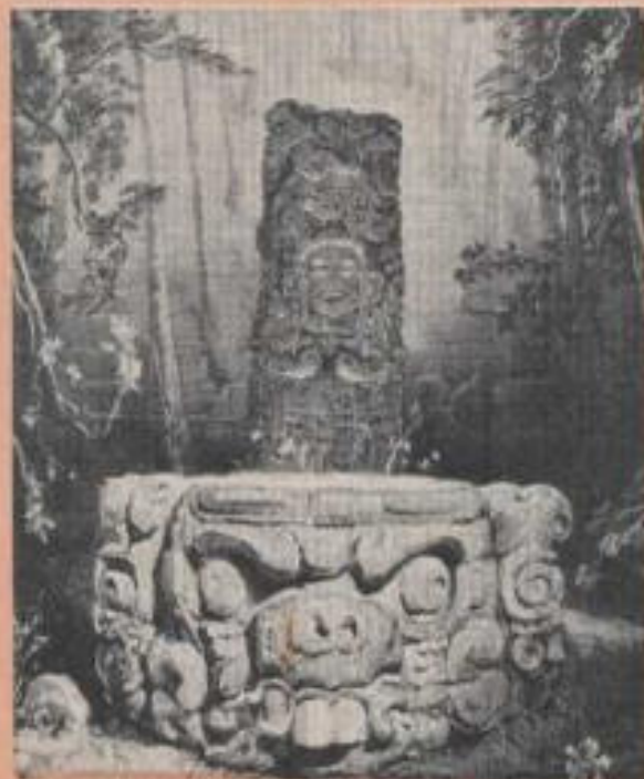
Altar de Copán en Honduras, dibujo de Frederick Catherwood.

Un comunicado emitido por la oficina central de la Expedición Raleigh en Londres dice que "la relativa importancia de este descubrimiento no puede ser confirmado hasta que se hagan estudios arqueo-