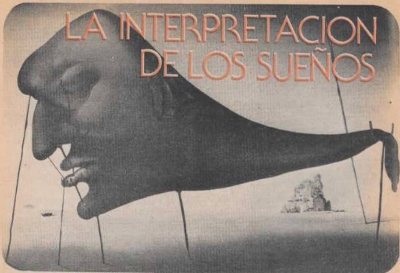
Famosa pintura de Salvador Dalí, donde se muestra el balance psíquico que hace posible el sueño.

Apoyándonos en los estudios y teorías de Freud y de Jung, expliquemos para el intérprete de los sueños que son descargas del subconsciente que se expresan de las más variadas formas. Psicólogos famosos como Hall y Perls reconocen que los sueños emplean un lenguaje de imágenes simbólicas reveladoras del soñador y de sus problemas. Ambos insisten, como lo hizo Jung, en que cualquier sueño encierra una referencia a la actual situación vital del interesado y opinan que debe interpretarse del modo que resulta más útil a la persona interesada.