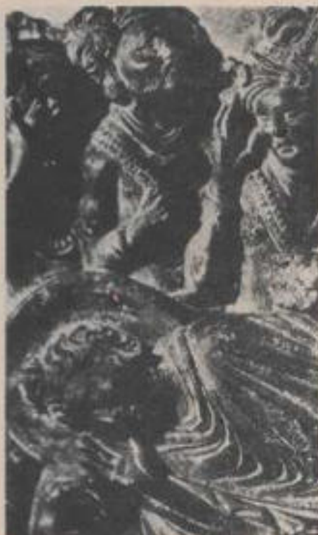
La muerte del Buda, rodeado de sus discípulos. Escultura hindú del siglo II.

Sin embargo, el budismo corrigió el jainismo, concibiendo el Karma como moral: el acto es simplemente la intención de la voluntad . En este punto el budismo está correcto. El acto, Karma, de ninguna manera podría ser físico, como también independiente de la acción externa física como tal. Por ejemplo, la