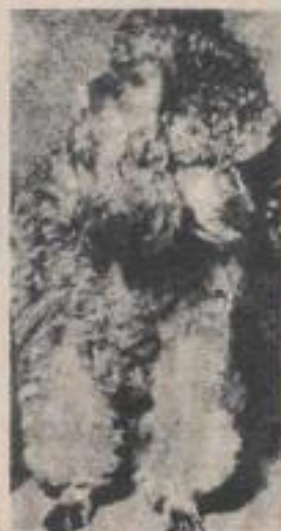
Un investigador alemán ha descubierto, después de haber realizado un minucioso estudio, que la mayoría de los perros poseen poderes psíquicos.

Usando ese mismo método Eisenheim llevo a cabo un estudio en el que intervinieron decenas de perros, controlados por sus amos. En esa encuesta se demostró que un 90 por ciento de los animales presintieron con bastante anticipación la llegada de sus amos.