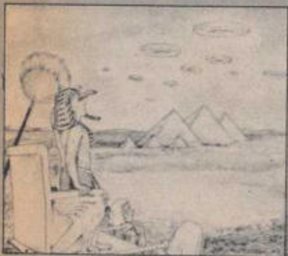
Una enorme flotilla de naves espaciales, semejantes a "círculos de fuego", descendió sobre el Egipto del faraón Tutmosis III.

Otro experto en OVNIS además de estudioso de la Biblia, Zacharia Sitchin, opina que, sin lugar a dudas, este jeroglífico describe un viaje interestelar. "Tutmosis III —explica— debió ser transportado en un transbordador a una estación espacial, donde se reunió con una avanzada cultura del espacio, a la que los egipcios llamaron "dioses"; esto prueba que las visitas del espacio no son cosa del presente, sino que han ocurrido a lo largo de toda nuestra historia".