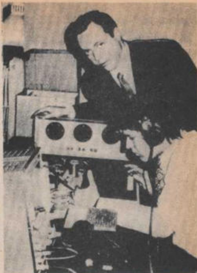
Es necesario un entrenamiento exhaustivo para interpretar correctamente las voces grabadas.

Todo cuando antecede nos puede llevar a una importante conclusión. Aunque propiamente hablando el consenso universal se refiere a la sobrevivencia, este concepto ha facilitado en muchas personas la creencia supersticiosa en la "comunicación", unificando la creencia universal, y cierta, en la sobrevivencia, con la creencia en la posibilidad de comunicación directa con los espíritus. La sobrevivencia forma parte de esa configuración ancestral universalmente extendida a todas las razas y pueblos, inherente a los misterios de la historia general del espíritu humano y ajena a la reminiscencia personal. Por tanto, esta "cultura-histórico-inconsciente-colectiva" que ya preexiste antes de nuestro nacimiento, influye y predispone al ser humano hacia una situación propicia a la superstición de la "comunicación", haciéndonos víctimas de nuestro inconsciente personal que manipula la información y juega con esa cultura hereditaria (Jung afirmaba que ya nacemos sumidos en un inconsciente colectivo creador de imágenes hereditarias).