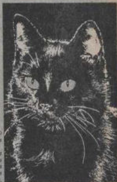
Está demostrado que los felinos poseen facultades extrasensitivas que les permiten predecir los sismos.

que los oficiales están convencidos de que "Herbie" les avisará con anticipación cualquier actividad sísmica que ocurra en la zona.