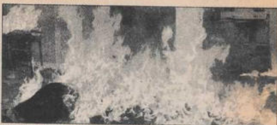
El fenómeno de la producción parapsicológica de un fuego se designa con el término de "pirogénesis".

Una pequeña caja de metal que contenía periódicos fue alcanzada dos veces por el fuego, que se apagó sólo después de haber consumido el contenido. Una cortina de tres metros de largo por dos de altura fue totalmente destruida por las llamas.