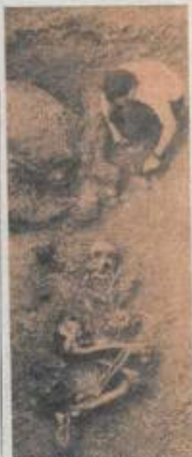
Monumento funerario donde reposan los restos de guerreros torturados durante la Edad de Hierro.