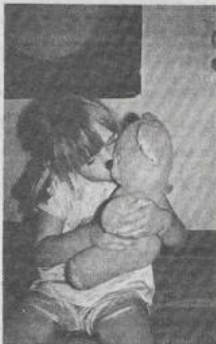
¿Cuáles son los verdaderos lazos que unen a los niños con los osos?

"Se ha dicho que era debido a las redondeces de su cuerpo o a la suavidad de su pelo. El oso parece cómodo a primera vista, tranquilizador y mullido, a causa de su adiposidad y de su abundante pelo. Pero existen muchos otros animales que también podrían aspirar a lo mismo y