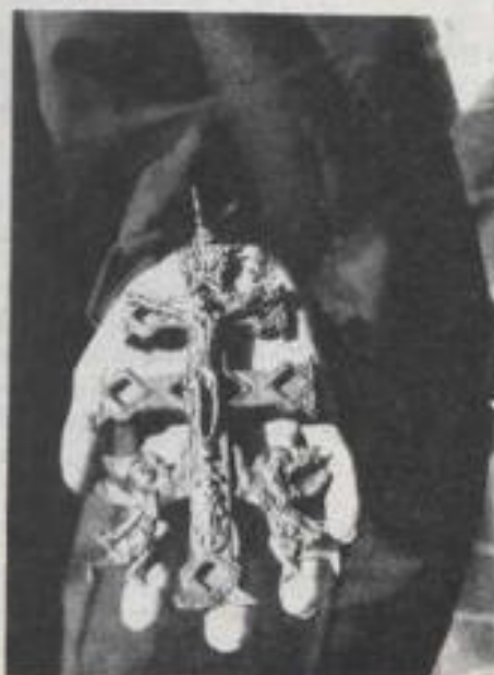
Son muchas las virtudes mágicas de esta cruz; por ejemplo, puede evitar los daños causados por catástrofes naturales, para aliviar varias enfermedades o simplemente como protección contra el mal.

El fuego no tiene frío, el agua no tiene sed, el aire no tiene color, el pan no tiene hambre: San Lorenzo, curad esas quemaduras por el poder que Dios os ha dado.