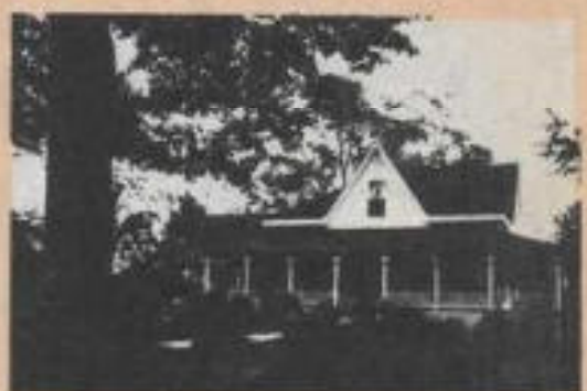
El espíritu de una jovencita ronda este lujoso restaurante de Georgia en busca de su madre.

El solitario fantasma de una jovencita, ronda por una antigua mansión ahora convertida en lujoso restaurante y hotel en busca, al parecer, de su madre. El dueño del establecimiento, llamado Stovall House, localizado en el condado de Helen, Georgia, afirma que desde la remodelación de la casa, se dio cuenta de la existencia del espíritu, pero como éste no le ha causado ni a él ni a los huéspedes y empleados ningún problema serio, no piensa hacer nada para "desalojarlo". El señor Hamilton Schwartz, quien adquirió la solariega casa pocos años atrás, dice que ésta fue construida hace casi 150 años por un acaudalado comerciante llamado Moses Harshaw, quien además de una gran riqueza poseía un carácter endemoniado con el que hacía sufrir tanto a sus esclavos, como a sus familiares, llegando al extremo de causar la muerte prematura de su hija