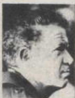
El ufólogo norteamericano Roland Burke, afirma que los extraterrestres se han apoderado del Pentágono.

"Los alienígenas son ahora quienes deciden todas las operaciones militares de los Estados Unidos, pues se han infiltrado en el gobierno; y en sus manos está el destino de toda la Tierra", afirma Burke, quien está convencido de que todos los despliegues bélicos de los Estados Unidos contra Libia, Nicaragua y Grenada, fueron ordenados por esos extraterrestres, quienes desean que el mundo entero entre en guerra para apoderarse luego de él. Burke dice también que su patria se ha convertido en un pueblo agresor debido a la influencia de esos seres, por lo que es urgente que se haga algo al respecto.