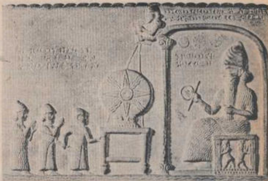
Los sumerios y sus sucesores desarrollaron un complicado sistema de religión y magia.

La influencia de sus aberraciones mágicas llegó incluso a España, a la que conmovieron con los ritos