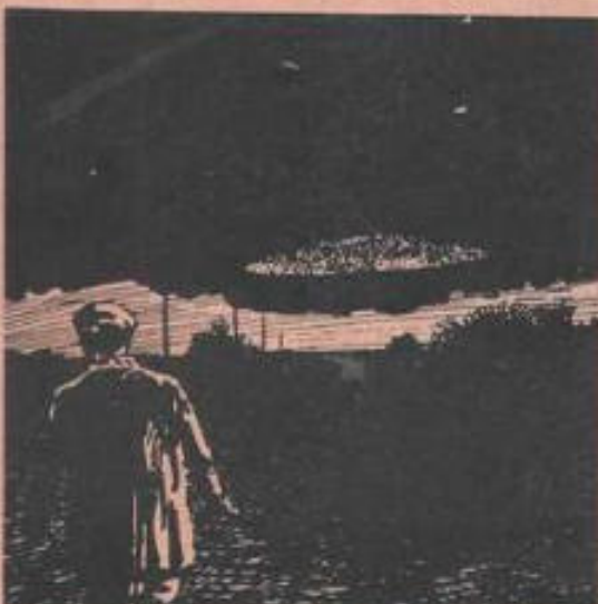
La mayoría de los habitantes de la ciudad de León, Guanajuato, afirmaron haber visto OVNIS el pasado mes de abril.

Según informaron algunos diarios capitalinos, el conocido investigador de este fenómeno, Pedro Ferriz, llegó a esa ciudad acompañado de un grupo de expertos y de un equipo de filmación, para investigar a fondo el caso.