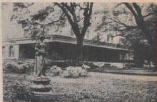
Los Mirtos, mansión de más de 190 años, está habitada por fantasmas.