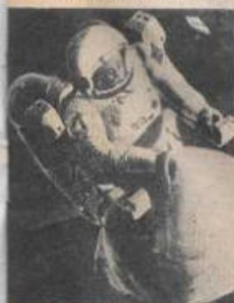
Los astronautas que se vean obligados a salir de sus naves estarán más expuestos a contaminarse.