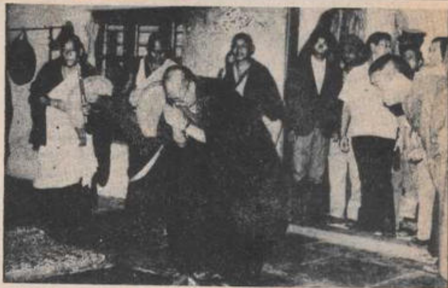
El Dalai Lama saludando a su llegada a la India, en compañía de sus colaboradores más cercanos.