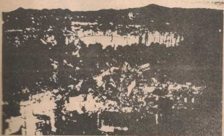
La leyenda de que en este sitio existió un importante centro ceremonial indígena se ve reforzada por el hecho de que en un área tan reducida se encuentran dos capillas cristianas, una en el fondo de la cañada y otra en lo alto del cerro.

La construcción de la iglesia es ya de por sí un indicio valioso para el análisis del lugar. Es sabido que fue una costumbre española erigir templos católicos en los sitios donde tradicionalmente se adoraba a los dioses paganos, y en esta zona en particular la cuestión no se reduce a un solo templo, pues en la cumbre de una pequeña montaña, donde los lugareños afirman que se han efectuado "milagros", se encuentran una ermita de la Virgen de Guadalupe y más adelante, en el poblado de Huascalzotla, hay otra iglesia más grande.