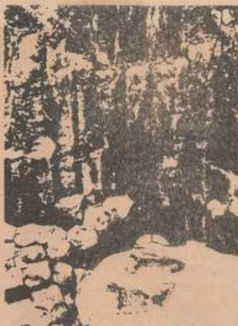
Columnas perfectamente conformadas en sucesión. Los geólogos ofrecen explicaciones sobre su formación que se contradicen. Los viejos de Santa María Regla afirman que las hicieron los dioses. ¿Quién tendrá la razón?

Si todo esto se redujera a un solo lugar en la geografía de un país, podríamos decir que se trata de una coincidencia, una curiosidad fortuita de la naturaleza. Sin embargo, no es así; a bastantes kilómetros de Santa María Regla y del esta-