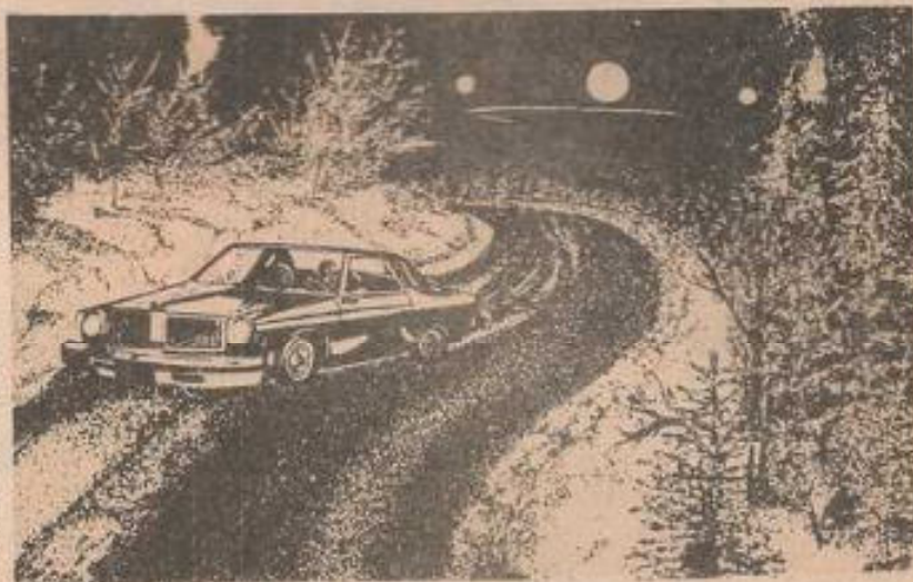
El OVNI persiguió al automóvil a lo largo de la carretera; mientras sus tripulantes se refugiaban en un restaurante, el objeto aguardó en el exterior pacientemente.

declaraciones de Onofre Paladino, propietario del establecimiento, el OVNI destruyó el tejado del lo- cal: "Todo ocurrió en menos de un segundo —explicó el propietario—, y sin hacer el menor ruido..."