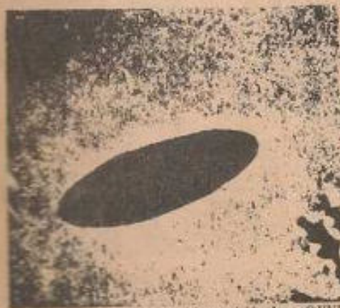
Consternación y pánico causó la aparición de un OVNI en una oscura zona de la ciudad de Bucaramanga.