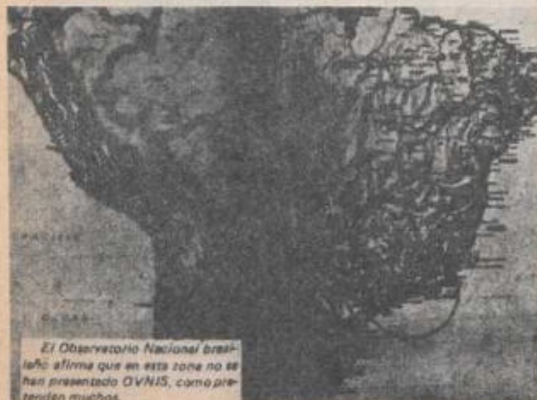
El Observatorio Nacional brasileño afirma que en esta zona no se han presentado OVNIS, como pretenden muchos.

Aun cuando no se han recibido informes sobre los resultados de este experimento consideramos que el intento es muy válido y viene a demostrar que la espectacular película de Spielberg ha comenzado a abrir nuevos caminos y posibilidades para que los OVNIS sean observados y estudiados abiertamente en todo el mundo.