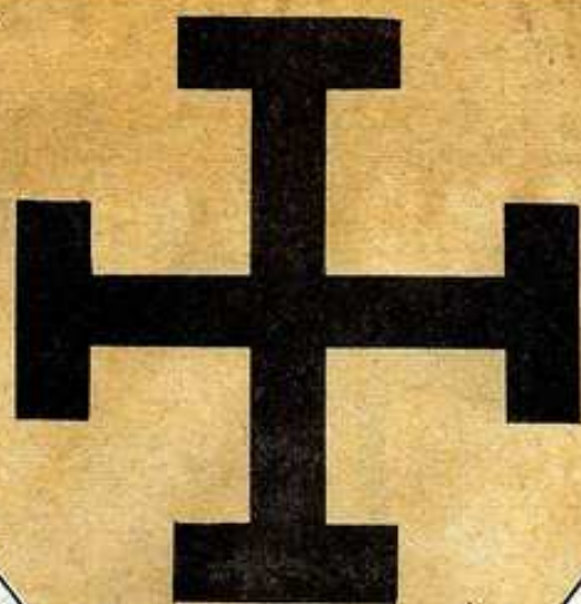
CRUZ DE JERUSALÉN (POTENZADA)