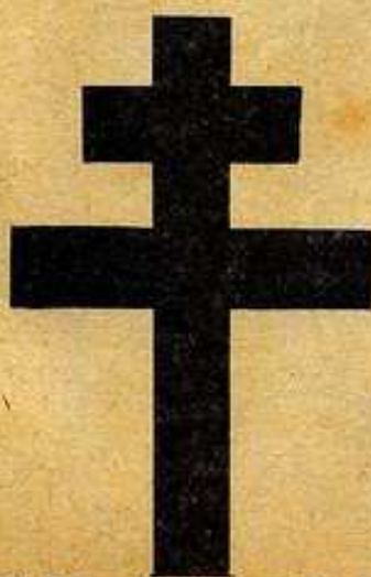
CRUZ DE LORENA

CONOCIDA TAMBIÉN COMO CRUZ DE SAN ANTONIO