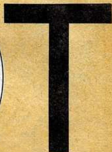
CRUZ CAMMISA O DE PATÍBULO

CONOCIDA TAMBIÉN COMO CRUZ DE SAN ANTONIO