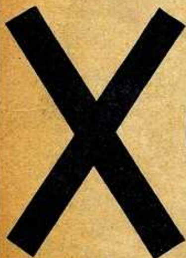
CRUZ DECUSATA (DE SAN ANDRÉS)